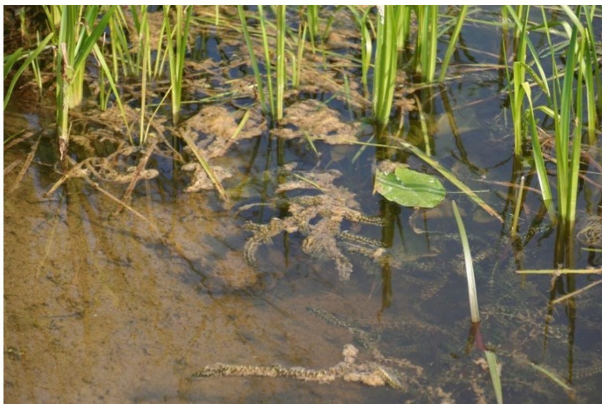
Foto: Võnnu oja ökoloogiline seisund hinnati põhjaloomastiku indeksite järgi kesiseks . See oli oja eutrofeerunud väljanägemise tõttu ka ootuspärane, kuigi ootasime kesise seisundi indikaatoriteks ränivetikaid või suurtaimestikku. Varasemad andmed oja seisundi kohta puuduvad.