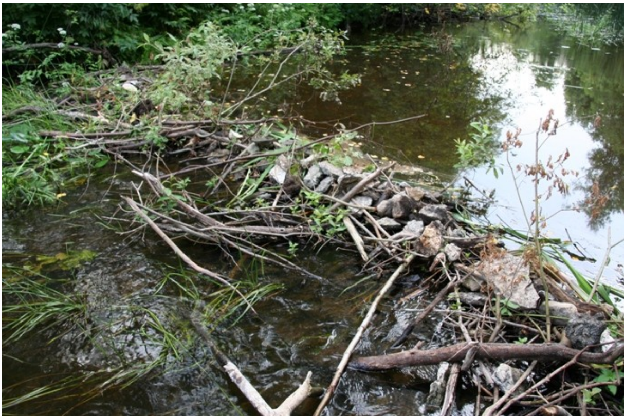
Foto: Üks selline värskest ehitatud koprapais oli jõel ka 2013. aasta seiretööde ajal.

Otsesed antropogeensed survetegurid kalastiku jaoks Trummi lõigus puuduvad. Peamiseks ohuteguriks kalastiku jaoks on jõe aeg-ajalt tekkida võivad koprapaisud.