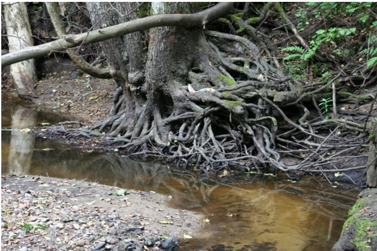
Kolga oja 2014. aasta juulis.

OÜ Eesti Keskkonnauuringute Keskuse poolt tehtud veeanalüüside põhjal vastas jõe vesi ökoloogilisele seisundiklassile väga hea .