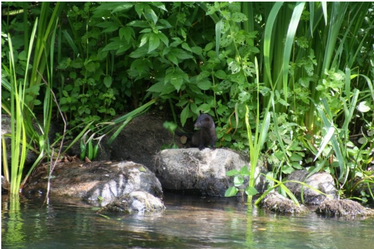
Foto: Eesti ohustatud liikide punase nimestiku liik mink (kategoria: mittehinnatav) Võhandu jõe ääres.

Riikliku hüdrokeemilise seire tulemustest on jõe seisundi hindamiseks kasutatavad viiendasse kogumisse kuuluva Himmaste seirejaama andmed, mille põhjal vastas seal vesi ökoloogilisele seisundiklassile väga hea . Nii oli see ka aastal 2012.