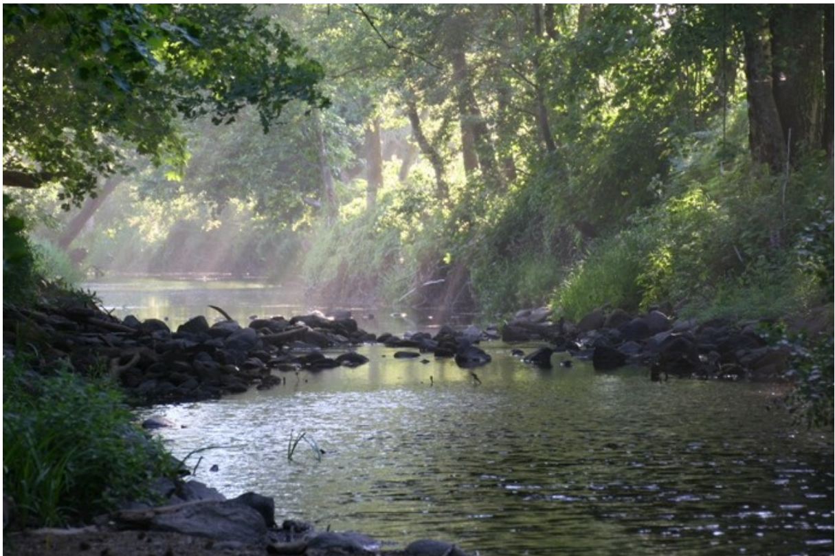
Foto: Rannametsa jõe alamjooks 2014. aasta juulis.

OÜ Eesti Keskkonnauuringute Keskuse poolt tehtud veeanalüüside põhjal vastas jõe vesi esimeses veekogumis Laiksaare paisust ülesvoolu seisundiklassile kesine , Arakoja suudme ja Laiksaare paisu vahel seisundiklassile väga hea ning teises veekogumis seisundiklassile hea . Ebastabiilseid hapnikuolusid esines kogu jões.