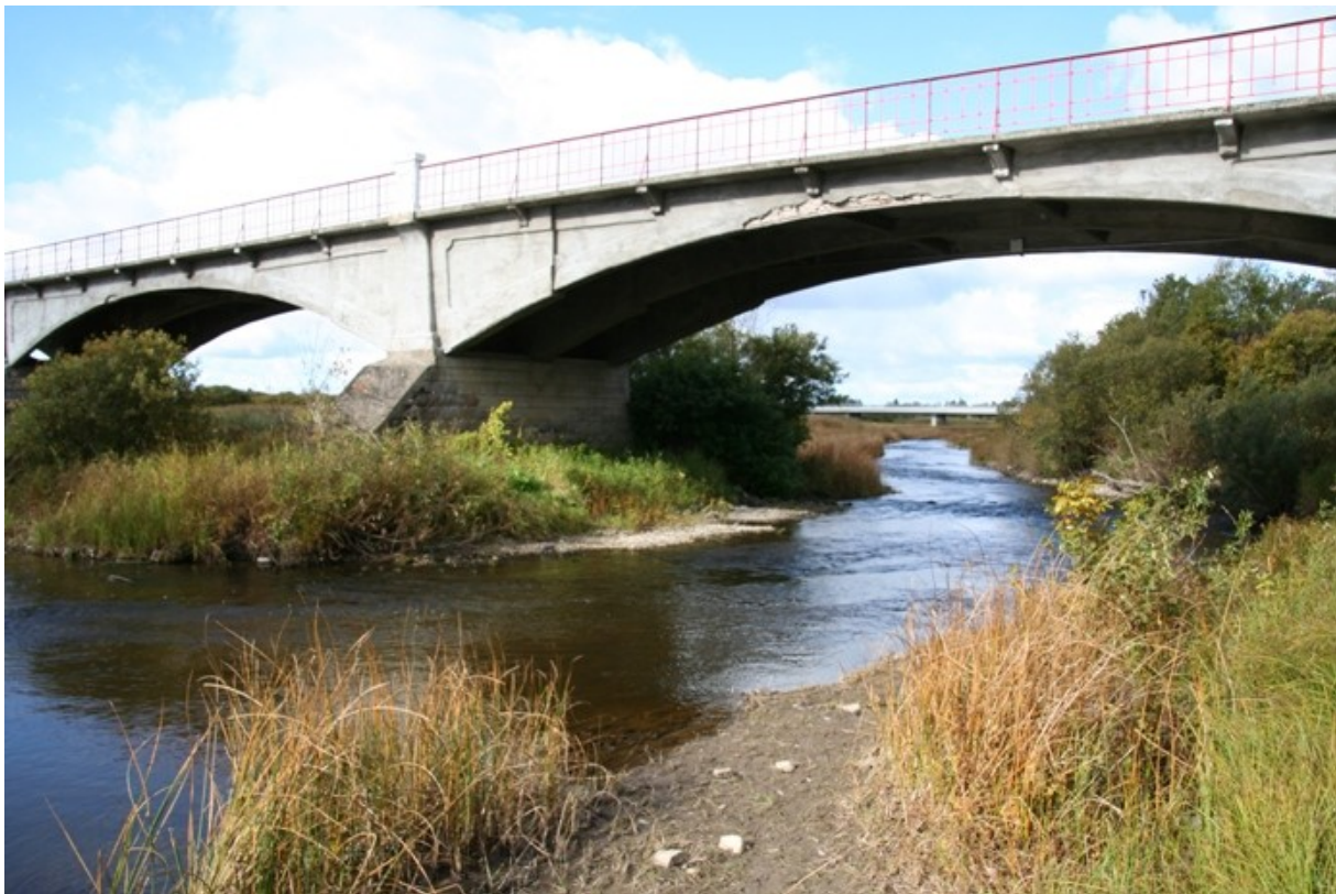
Foto: Septembris oli Kasari jõe veetase väga madal.

Kasari jõe seisundit ei ole varem fütoplanktoni järgi hinnatud.