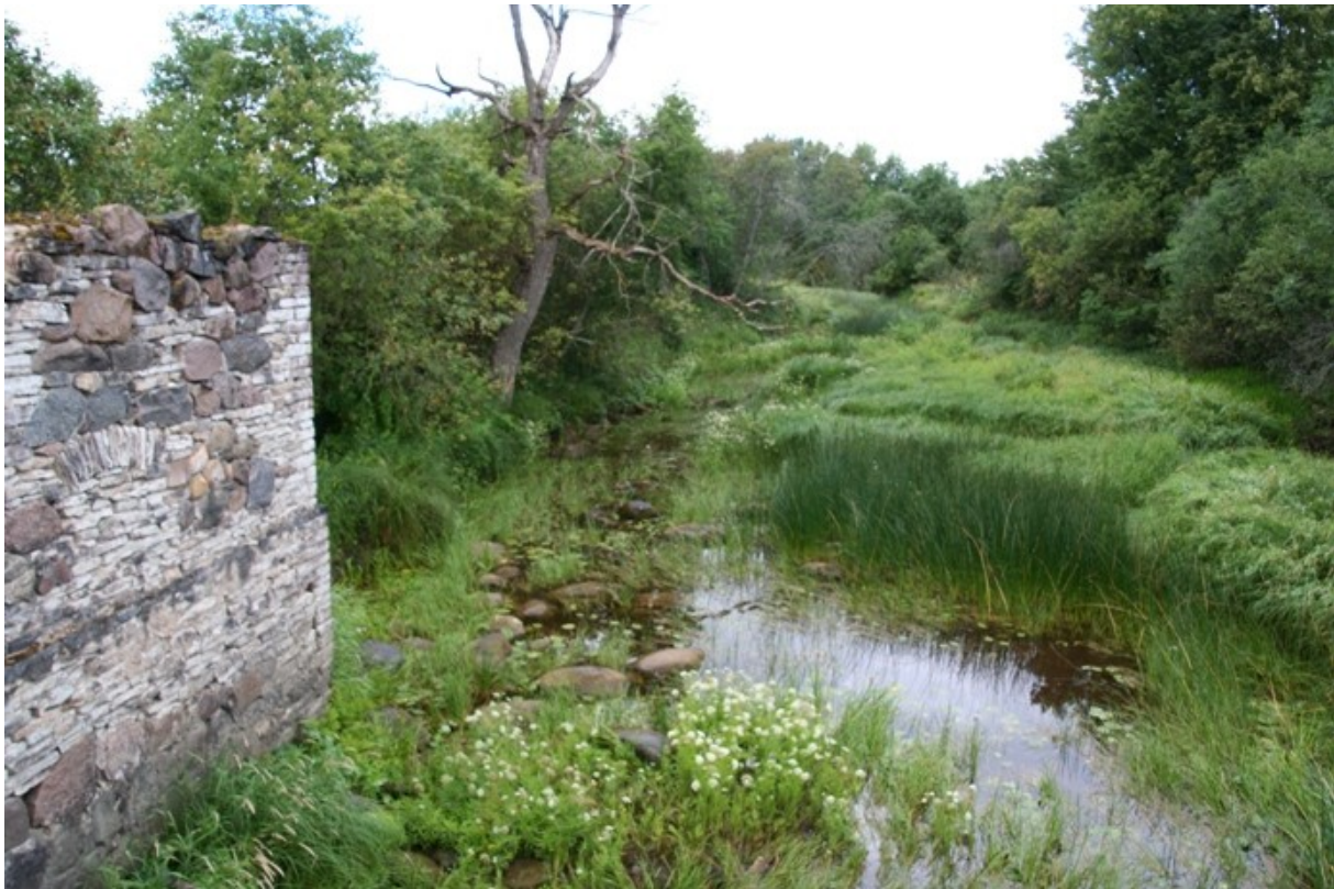
Foto: Nurtu jõgi alamjooksul 2014. aasta juulis.

OÜ Eesti Keskkonnauuringute Keskuse poolt tehtud veeanalüüside põhjal vastas jõe vesi ökoloogilisele seisundiklassile väga hea .