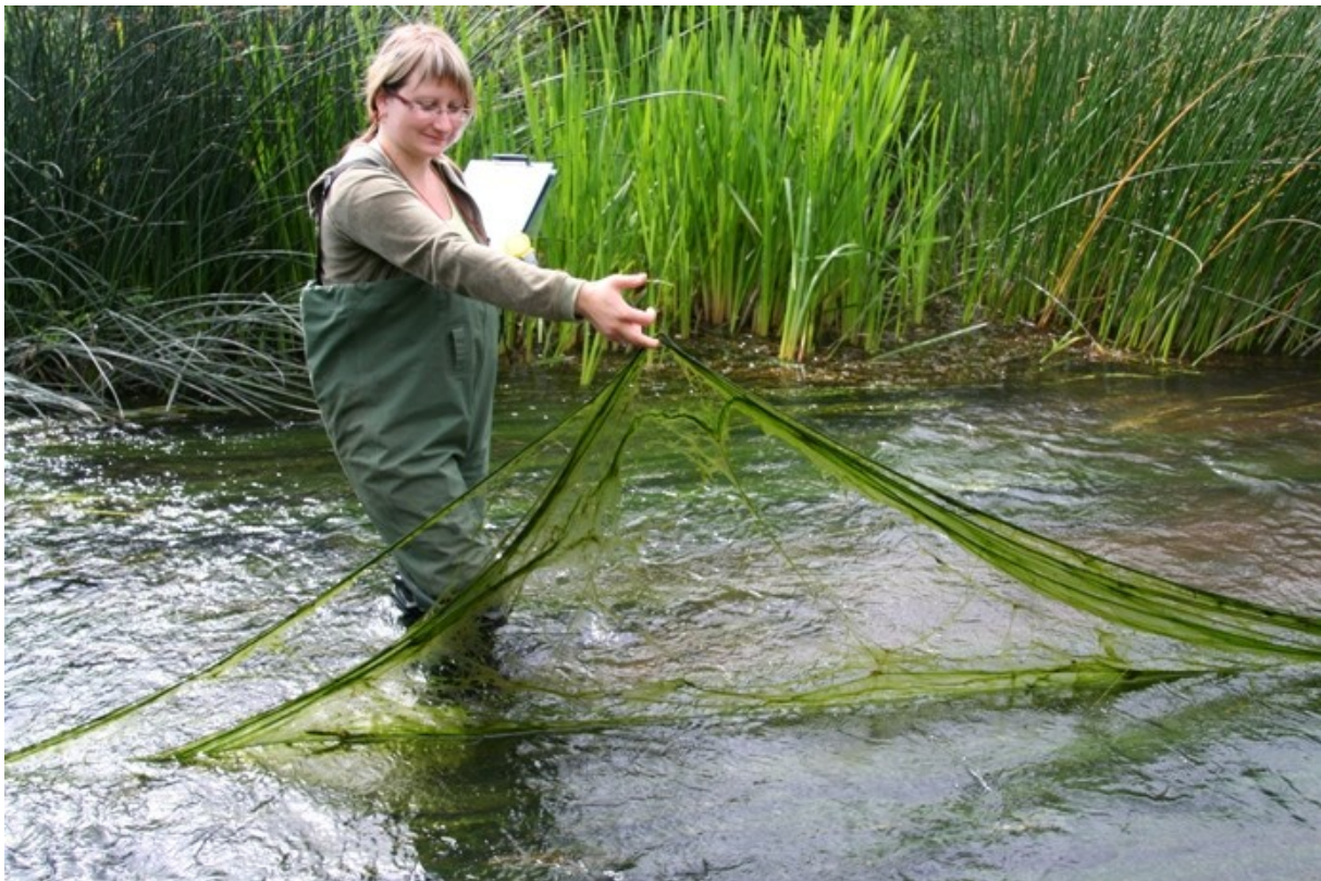
Foto: Kariste seirelõigus esines ohtralt niitjat rohevetikat, mis andis jõelõigule eutrofeerunud väljanägemise.

Esimeses veekogumis Karistel oli taimestiku üldkatvus 110% (taimestik esines mitmes kihis). Kokku registreeriti 24 taksonit suurtaimi, neist 4 taksonit makrovetikaid, üks samblaliik ning 19 liiki soontaimi. Domineerisid läik-penikeel ( Potamogeton lucens ) ja ujuv penikeel ( P. natans ). Arvukalt esines ka kaelus-penikeelt ( P. perfoliatus ). Taimestikuindeksi väärtuse järgi (42,7) oli seirelõigu seisund siiski väga hea, nagu ka 2010. aastal. Seirelõigus esines II kategooria kaitsealune ning ohustatud liikide punase nimestiku (kategooria: ohulähedane) liik oja-hanepuik ( Berula erecta ).