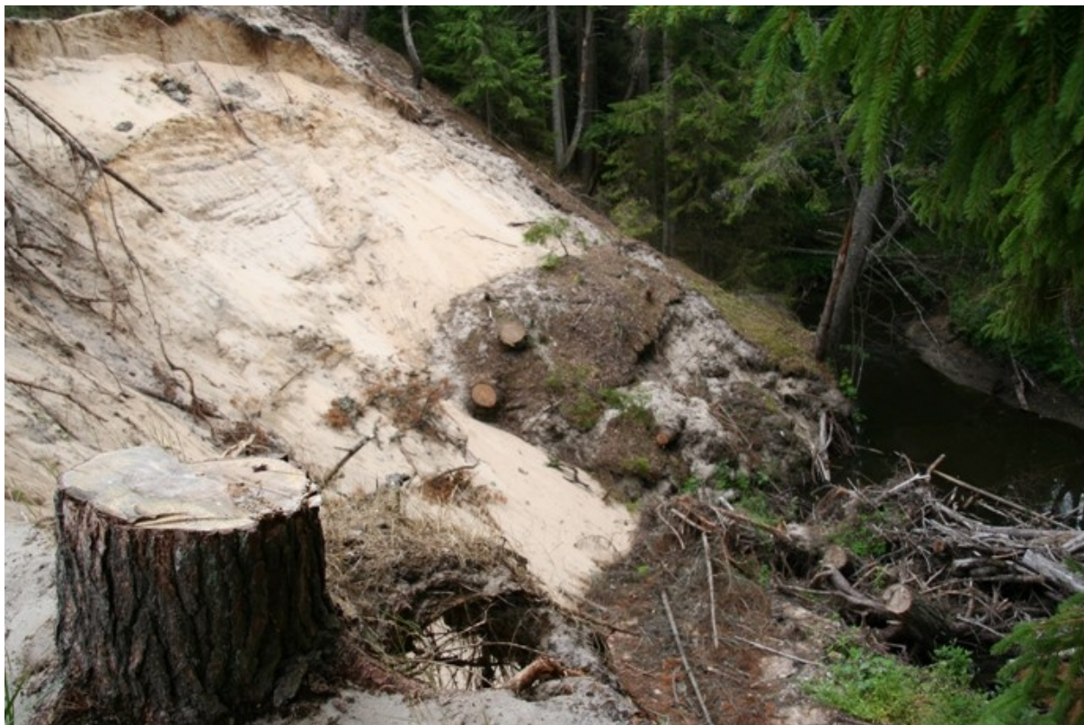
Foto: Kaldaerosioon Kolga oja seirelõigus võis mõjutada ka elustiku seisundihinnangut.

Kolga oja ökoloogiline seisund osutus kesiseks . Lisaks juba kalastiku juures viidatud surveteguritele, oli 2013.aasta suvel Kolga oja seirelõigust vahetult ülesvoolu väga tugev kaldaerosioon, mis võis samuti elustikku mõjutada. Põhjaloomade proovid koguti kevadel enne erosiooni. Varasemad andmed oja seisundi kohta elustiku põhjal puuduvad.