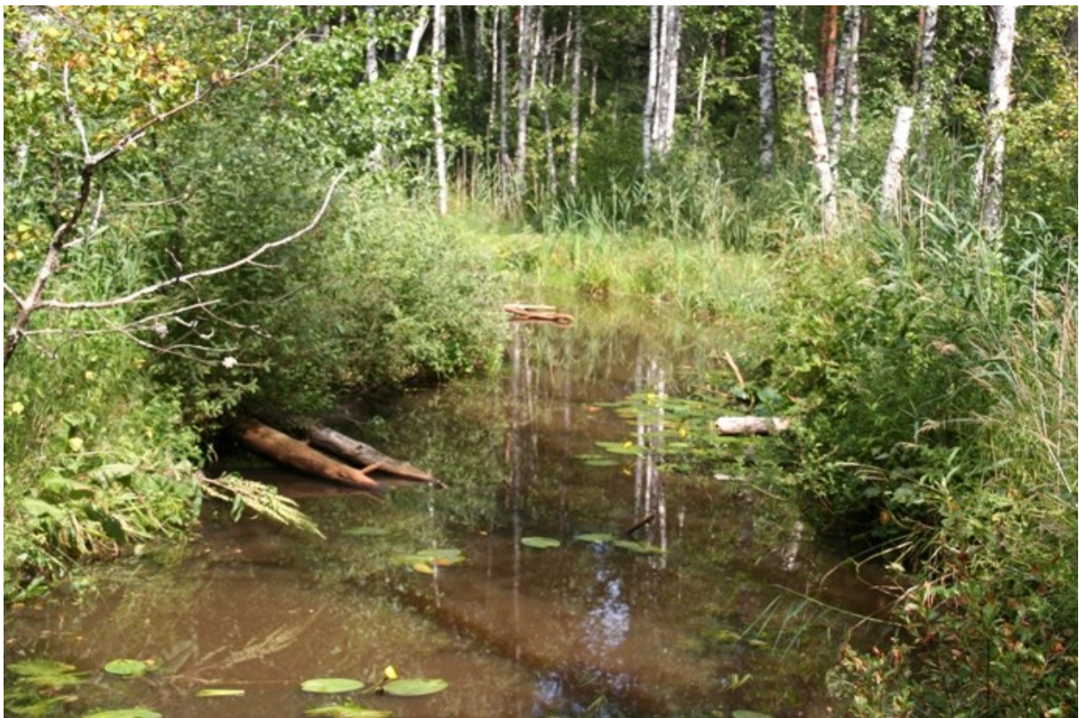
Foto: Mustjõgi Linnusaare rabas 2014. aasta juulis.

Riikliku jõgede hüdrokeemilise seire andmetel vastas jõe vesi ökoloogilisele seisundiklassile hea .