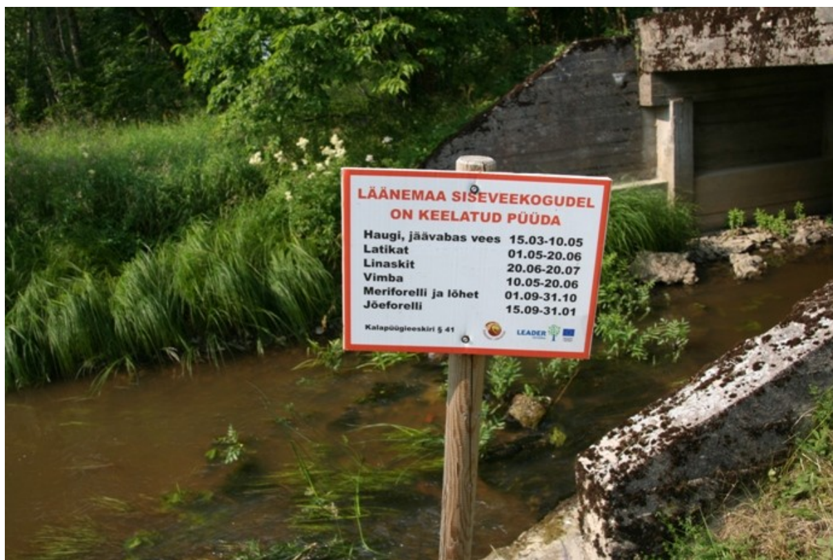
Foto: Vaatamata hoiatussiltidele on Taebla jõe alamjooksul kalastikuga midagi lahti.