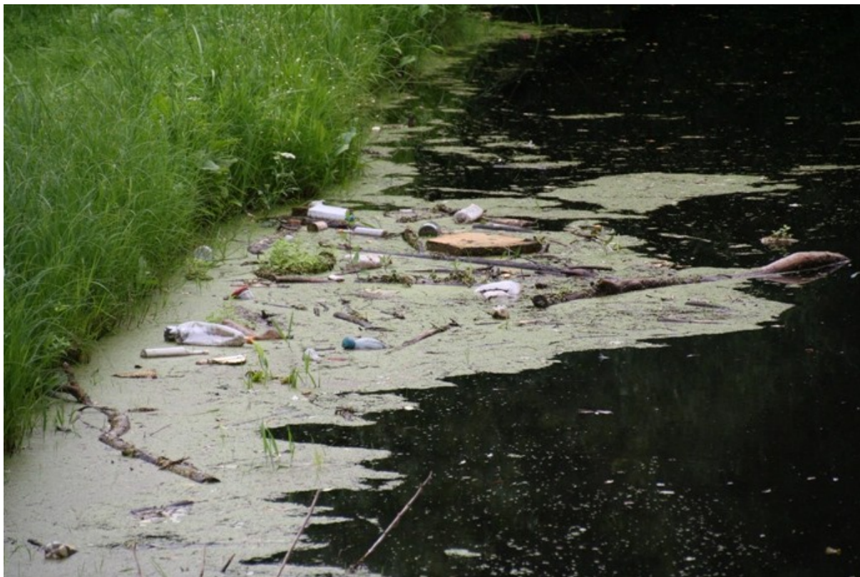
Foto: Hulgajuurine vesilääts, väike lemmel ja olmeprügi – dominandid Audru jõe Männi seirelõigus.

Männi seirelõigus oli taimestiku üldkatvus 5%. Registreeriti 8 liiki soontaimi, neist 5 helofüüti ja 3 hüdrofüüti. Makrovetikad ja samblad puudusid. Dominantliik ei eristunud, kuid ohtramad liigid olid hulgajuurine vesilääts ( Spirodela polyrhiza ) ja väike lemmel ( Lemna minor ). Taimestikuindeksi väärtuse järgi (27,4) oli seirelõigu seisund kesine .