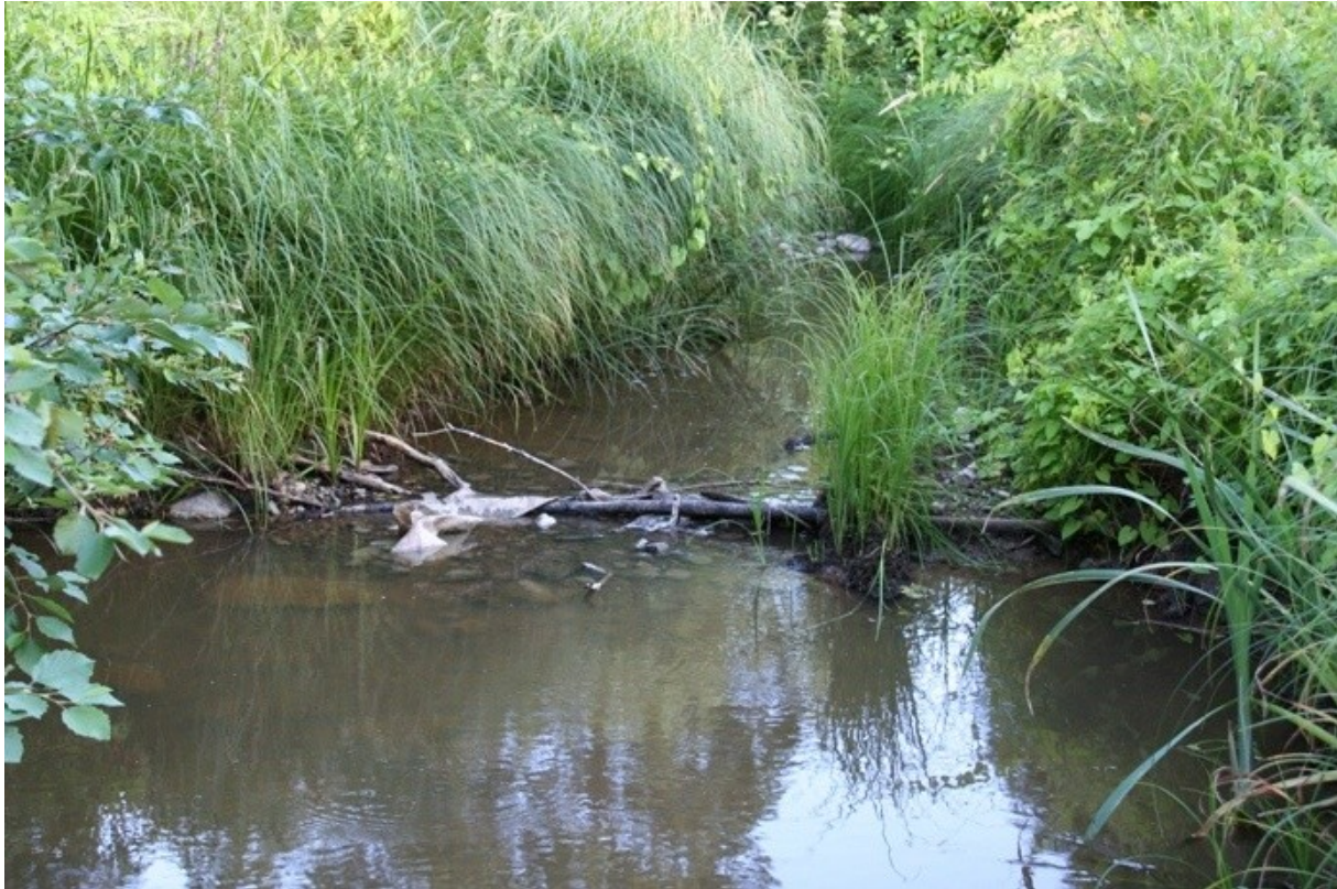
Foto: Penijõe seirelõik ei jätnud eriti positiivset muljet.