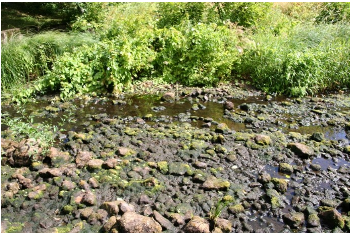
Foto: Kohaliku loodushuvilise sõnul on Enge jõe Kivi-Vigala paisualuse veevaegus igasuvine probleem.

OÜ Eesti Keskkonnauuringute Keskuse poolt tehtud veeanalüüside põhjal vastas jõe vesi ökoloogilisele seisundiklassile kesine ülemäärase üldfosfori- ja vähese hapnikusisalduse tõttu.